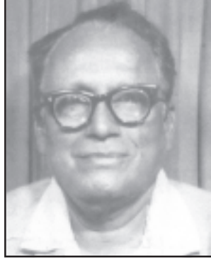
आचार्य प्रल्हाद केशव अत्रे

दोघांच्या संबंधात बाधा आली नाही आणि पुण्यातील एक सभेत, अत्र्यांनी त्यांना 'स्वातंत्र्यवीर' ही पदवी दिली. तसेच, सावरकरांनी अत्र्यांना 'आचार्य' ही उपाधी दिली.