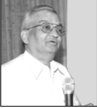
डॉ. अनिल काकोडकर