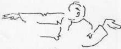
पं. कुमार गंधर्व : व्याख्यान १ ले